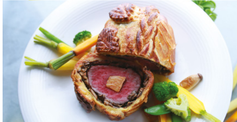
SERVICE BANQUETS page 42