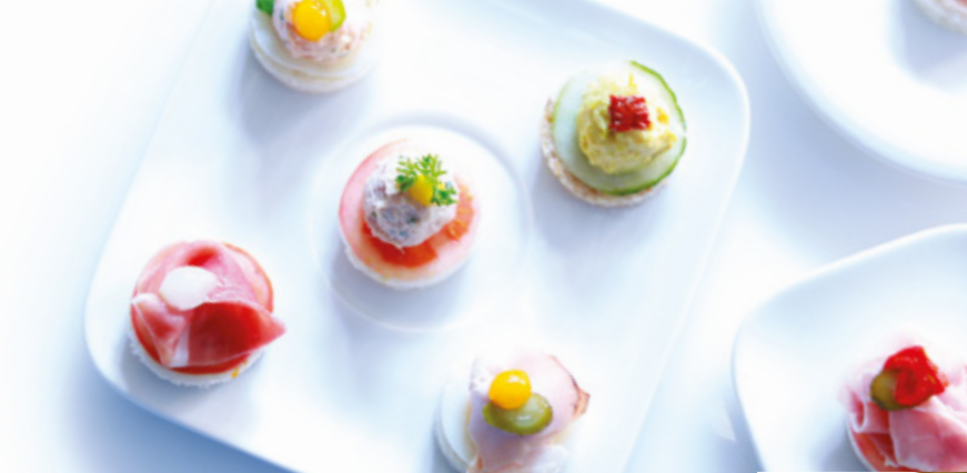
APERITIFS pages 6 - 11