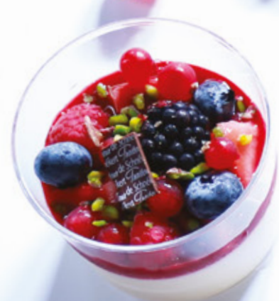
PANNACOTTA VANILLÉE AUX FRUITS ROUGES 957