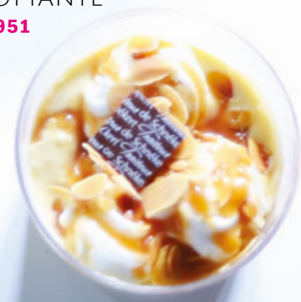
ILE FLOTTANTE 951