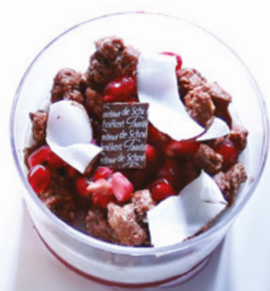
LA VEGAN 949 Pudding au Chia aromatisé au Crumble Cacao et Framboise