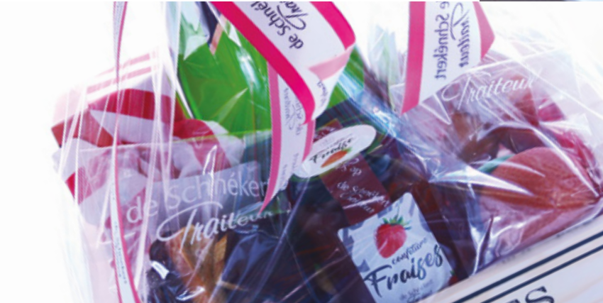
IDEES CADEAUX page 41