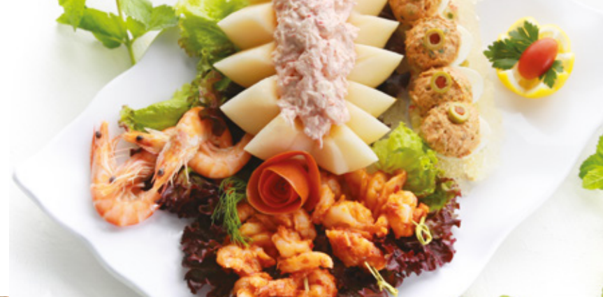
BUFFETS pages 27- 31