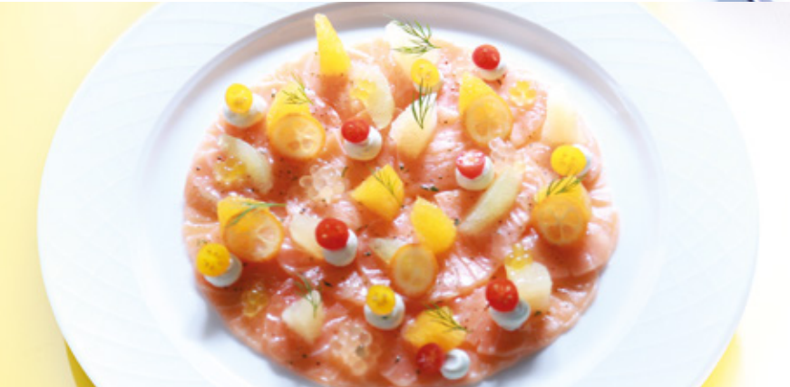
ENTREES pages 18 - 23