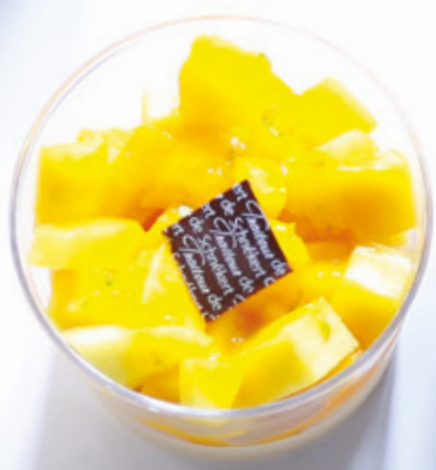
L'EXOTIQUE 950 Mousse Chocolat Blanc, Compotée Mangue - Passion