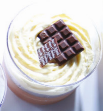
DUO DE CHOCOLATS 953