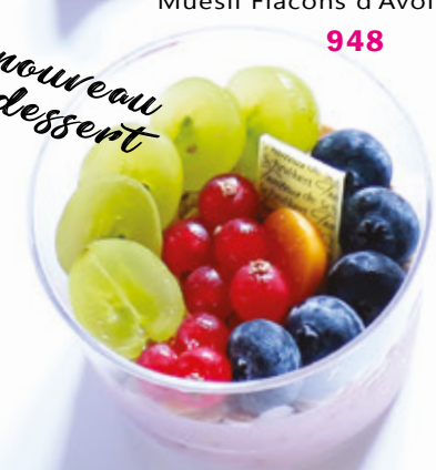
ENERGY BOWL Yaourt Myrtilles Muesli Flacons d'Avoine, Fruits 948