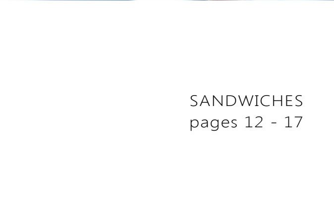
SANDWICHES pages 12 - 17