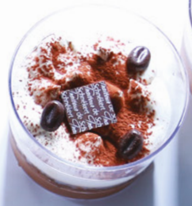
TIRAMISU À L'AMARETTO 955