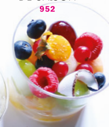
SALADE DE FRUITS DE SAISON 952