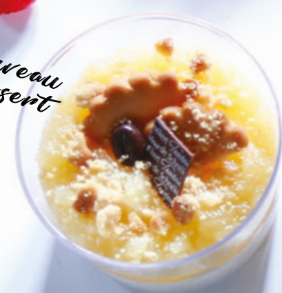
NUAGE MOKA A LA POIRE 954